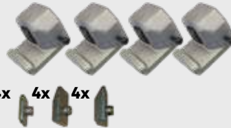
8-12100156 GL Garras para jantes de liga com inserções de plástico especiais