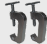
801271597 MV Par de terminais com parafuso para rodas com anéis elásticos