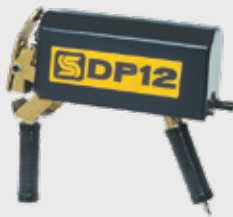
2201677 DP12 Dispositivo pneumático imprensa talão

Para mais informações, consulte o catálogo de acessórios completo