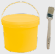
8-11400034 SGG Balde pequeno de massa (5 kg) com pincel