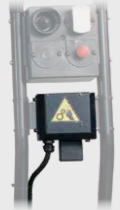
8-12120025 RC TROLLEY 2.4 Controle remoto à distância com 16 canais