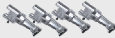
8-12100155 PA Extensões para auto-centralizante para jantes até 58"