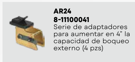
AR24 8-11100041 Serie de adaptadores para aumentar en 4" la capacidad de boqueo externo (4 pzs)