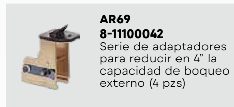
AR69 8-11100042 Serie de adaptadores para reducir en 4" la capacidad de boqueo externo (4 pzs)