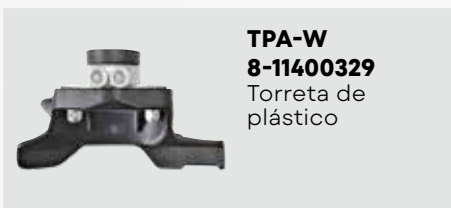
TPA-W 8-11100329 Torreta de plástico