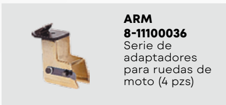
ARM 8-11100036 Serie de adaptadores para ruedas de moto (4 pzs)