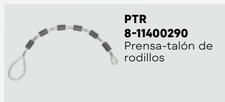
PTR 8-11400290 Prensa-talón de rodillos