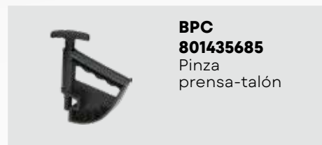
BPC 801435685 Pinza prensa-talón