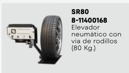
SR80 8-11400168 Elevador neumático con via de rodillos (80 Kg.)